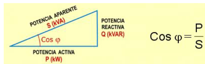
Figura 2. Triángulo de potencias para circuitos de corriente alterna.

Donde el torque está en N-m, la velocidad angular en rad/s, V_L e I_L son el voltaje y corriente de línea y el factor de potencia fp es \cos \phi , dicho ángulo puede encontrarse fácilmente conociendo los valores de la potencia activa (P) y reactiva (Q):